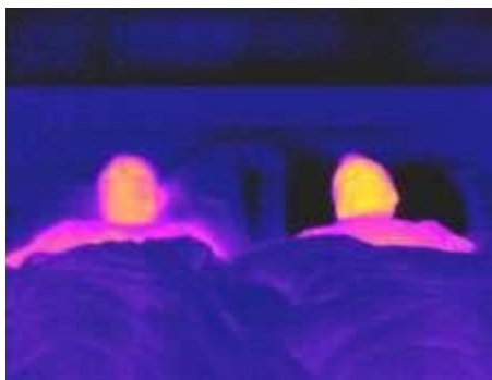
Chillow® en action sur la droite

De même, les produits Soothsoft absorbent en permanence la chaleur du corps et décharge à nouveau la chaleur absorbée dans le proche environnement. Le produit est en permanence frais puisque le consommateur est toujours plus chaud que le produit. Contrairement à la plupart des autres produits rafraîchissants, cette technologie est rafraîchissante et non excessivement froide, humide, gardant une position unique ou inconfortable. Cette science est simple, fonctionnelle, polyvalente, agréable, unique, sans nécessité d'entretien et simplement bien faite !